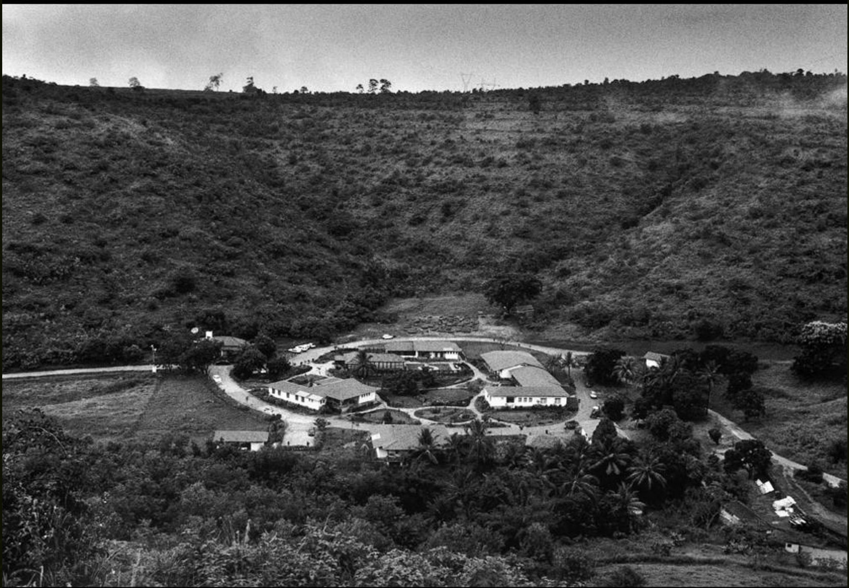
Instituto Terra at 2003 - © Sebastião Salgado